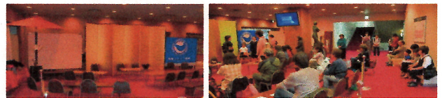
新宿文化センター大ホール2階ロビーで、新宿内小中学生の親子が来場者(無料)に抹茶をふるまう