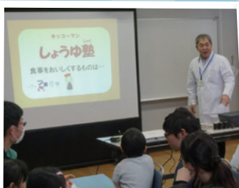
しょうゆ博士になろう!