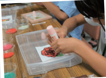
リサイクルガラススマート体験