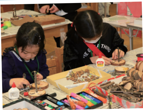
“新宿の森”自然工作