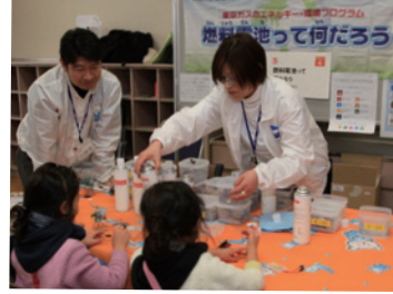
約50団体がブース出展♪

同時開催 令和元年度『環境学習発表会』 (主催：新宿区教育委員会) ※詳しくは、裏面へ。