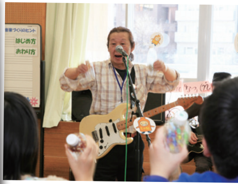
リユース楽器を作って演奏♪