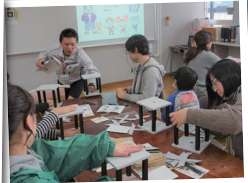
地震に備える建築ワークショップ