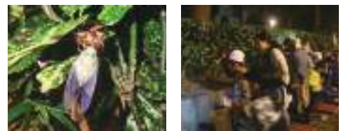
▲セミの羽化の様子(2018年夏 新宿中央公園にて)

この観察会は、『エコにトライ!』ではありません。申込方法などは、広報しんじゅく(6月15日号)か、新宿区立環境学習情報センター(エコギャラリー新宿)Webサイトでご確認ください。