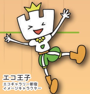
エコ王子 エコギャラリー新宿 イメージキャラクター

入会をご希望の方(新宿区在住・在学)は、以下の申込用紙にご記入の上、メールまたはFAXにてお申し込みください。折り返し、ご連絡いたします。