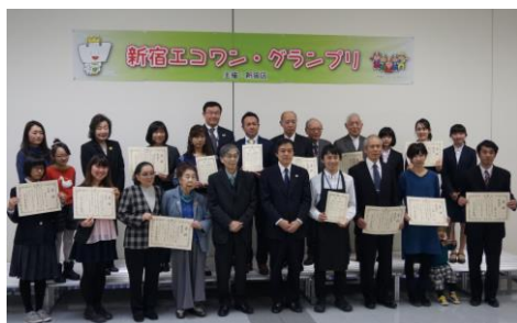
「第10回新宿エコワン・グランプリ」 受賞者 集合写真

3月11日(土)に新宿区立区民ギャラリーで「第10回新宿エコワン・グランプリ」の表彰式が行われました。個人・ファミリー部門、グループ部門、環境にやさしい事業者部門の3部門の表彰の他、3つの特別賞と新宿エコ自慢ポイント賞の表彰も行いました。