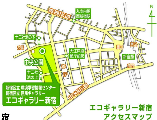
エコギャラリー新宿 アクセスマップ