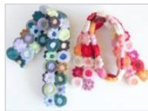
ワークショップ、リメイクデザイナーへの素材提供など